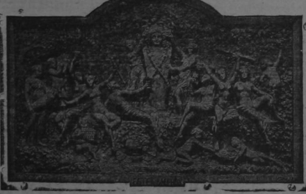
Bajo relieve esculpido en la Creta de las Cavas de Pommery & Greno en Reims, representando la Fiesta de Baco.

relieve que lleva por título El Champagne en el siglo XVIII. Describe una cena en época de la Regencia, y en la gruta número 16, otro bajo-relieve, que representa a Sileno.