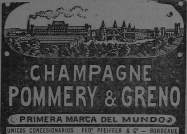
Vista General del Establecimiento Pommery & Greno en Reims

comodidad, y tanto los diferentes cuerpos de edificio como las inmensas bodegas en donde se almacenan las reservas de vinos añejos, están admirablemente provistos y arreglados para el completo tratamiento de que es objeto el champagne antes de ser puesto al consumo. El establecimiento con sus dependencias ocupa una superficie de 26 hectáreas y está rodeado de hermosos jardines y de dos grandes viñedos. De lo alto de sus torres se disfruta de un magnífico golpe de vista sobre la ciudad y sus alrededores.